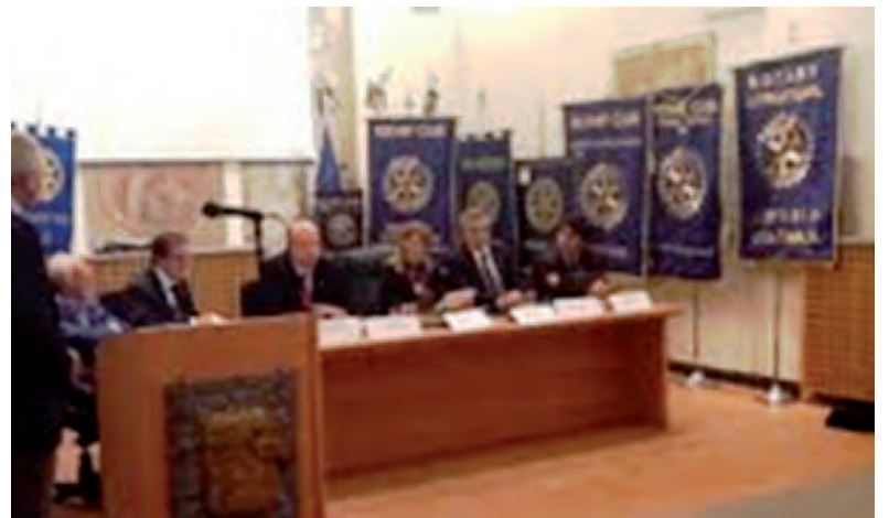
Foto ricordo di tutti i Presidenti di Club di area "etnea" con il Governatore Distrettuale ed i Relatori, nella sede del Parco dell'Etna a Nicolosi